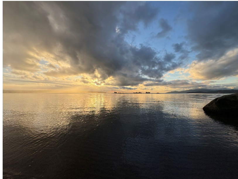
Stanley Park November 2025